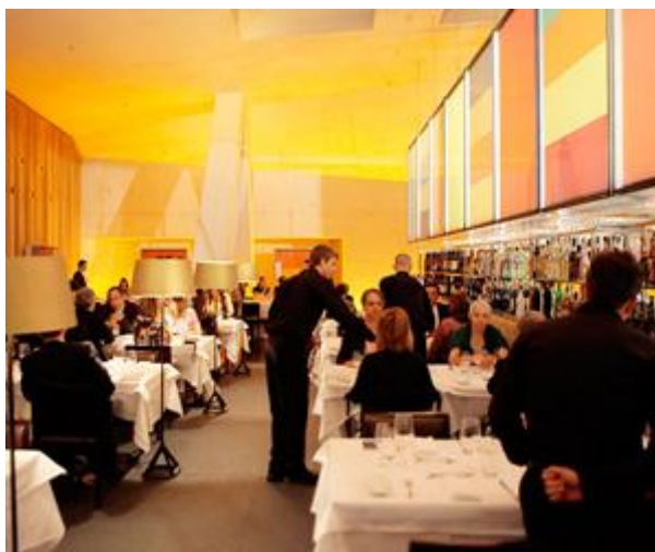
Restaurante Casa da Música